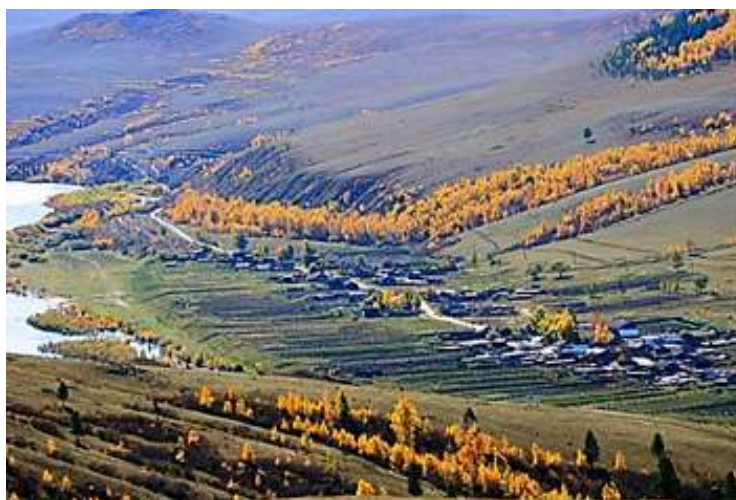
Рис.4. Пойменный тип местоположения, с. Правые Кумаки.

Селения в районе располагаются в пойме рек Шилка и Нерча как на левом, так и на правом берегу (Рис.4).