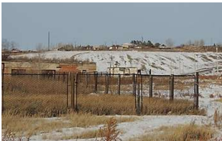
Рис.3. Нагорный тип местоположения, п. Нагорный

Селения в районе располагаются в пойме рек Шилка и Нерча как на левом, так и на правом берегу (Рис.4).