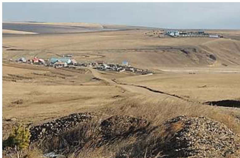
Рис.5. Холмисто-увалистый подтип местоположения, с. Верхний Умыкей